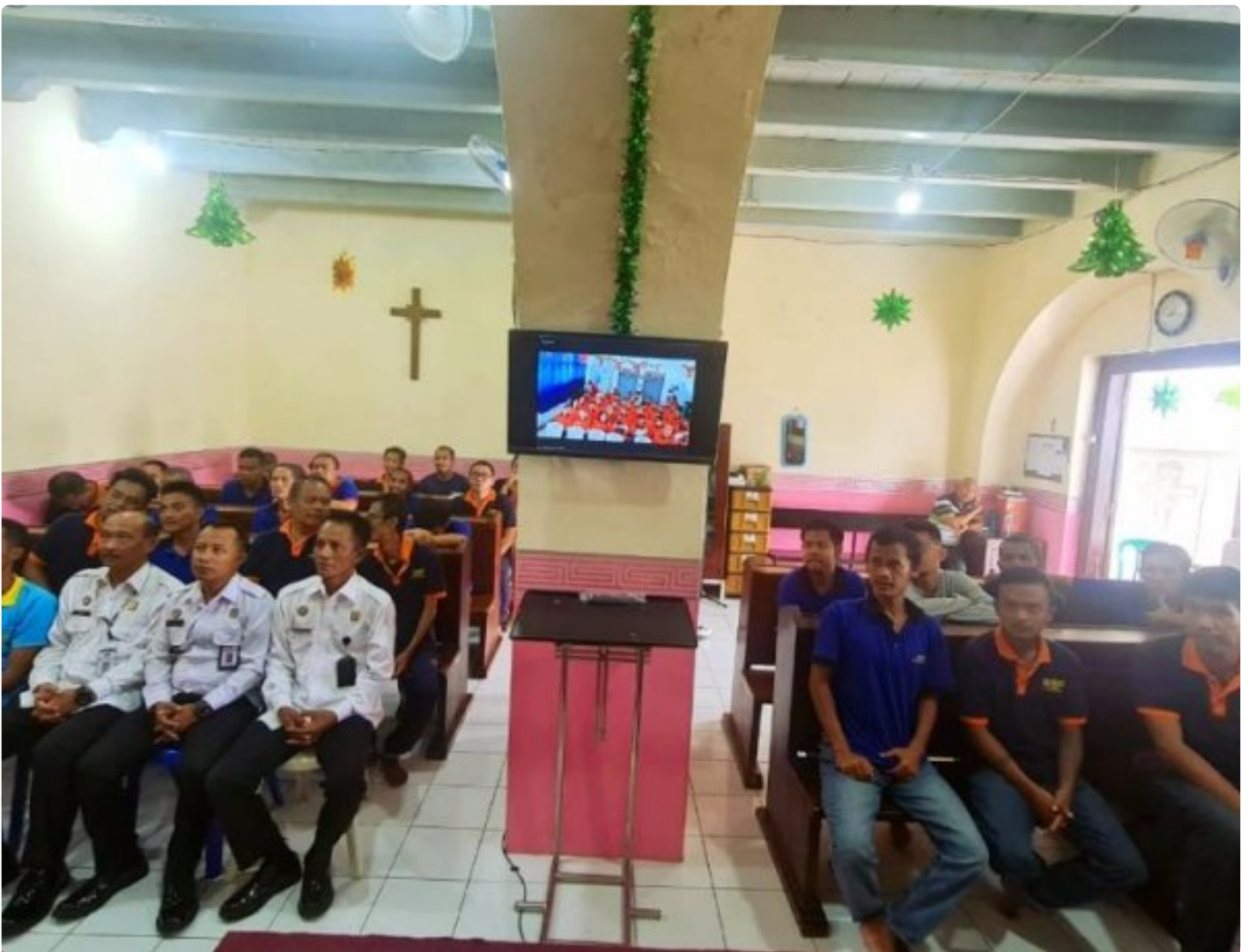
Secara Daring, Lapas Ambarawa Ikuti Perayaan Natal se Indonesia

AMBARAWA - Puluhan ribu tahanan dari 486 Lembaga Pemasyarakatan di seluruh Indonesia mengikuti perayaan Ibadah Natal Bersama secara daring, sebagai upaya integrasi dan persatuan dalam merayakan momen suci bersama,